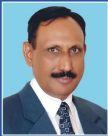
پروفیسر ڈاکٹر محمد اقبال ظفر وائس چانسلر